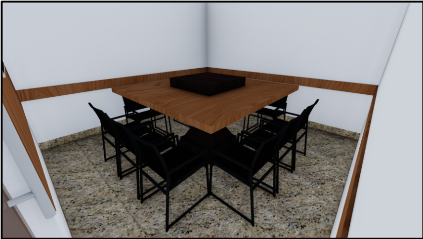
PERSPECTIVA 01 SEM ESCALA