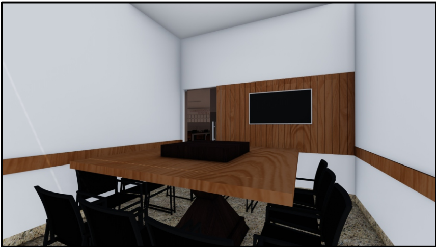
PERSPECTIVA 02 SEM ESCALA