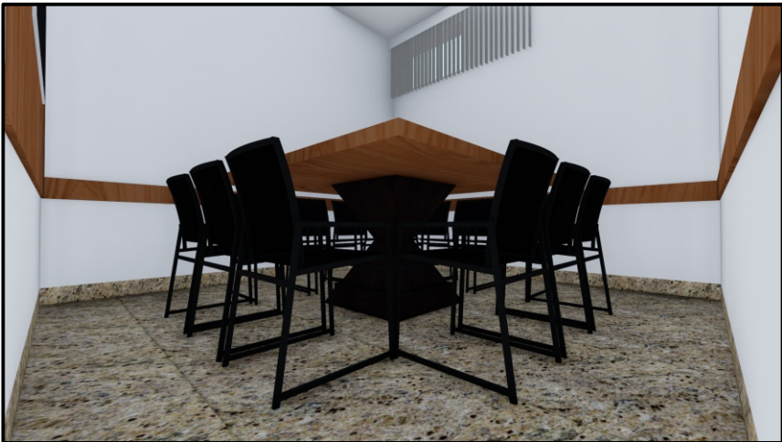
PERSPECTIVA 03 SEM ESCALA